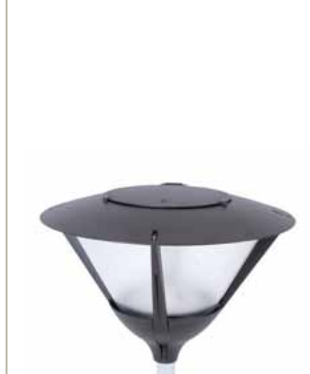
+ 100% tlačno lijevani aluminij 100% injection cast aluminium