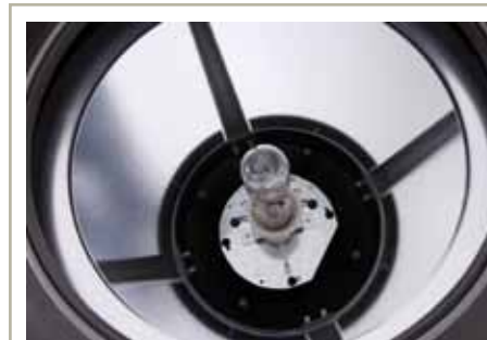
+ Veliki otvor na vrhu Ø300 mm Large hatch opening Ø300 mm