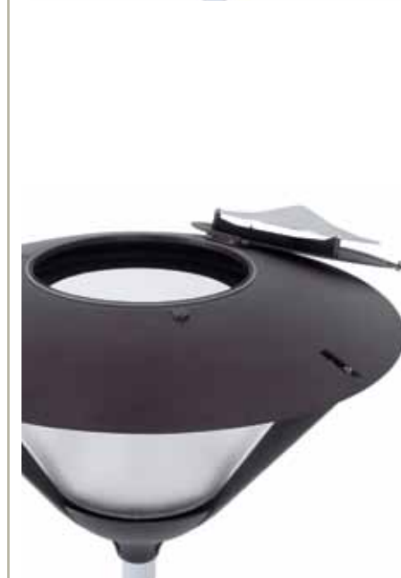
+ Zaobljeni bijeli aluminijski reflektor difuzne strukture Rounded white aluminium reflector diffusing structure